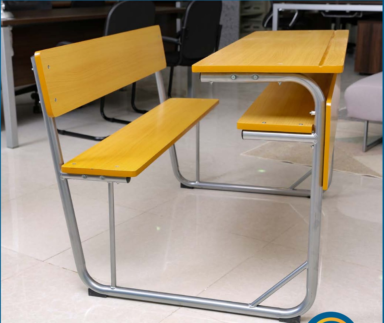
Carteira dupla monobloco

Proteja os seus Filhos do Vírus e das Bactérias